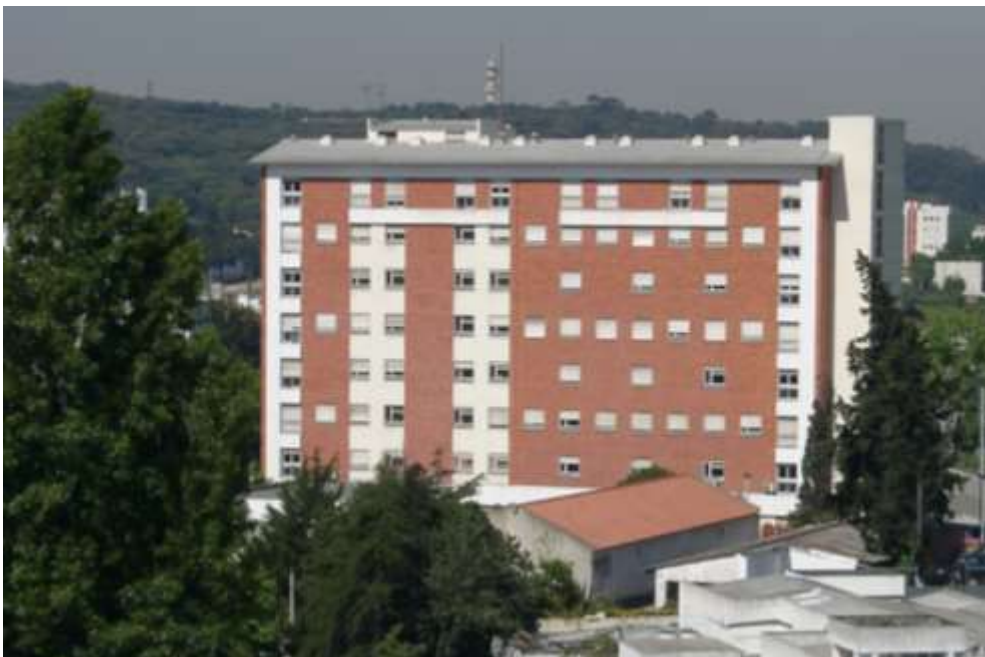
Figura 33. Lar dos Doentes, no Centro de Lisboa do IPOFG