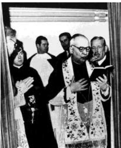
Figura 19. Inauguração da Capela pelo Cardeal Cerejeira