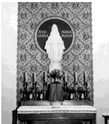
Figura 20. Escultura da Virgem, de mestre Leopoldo de Almeida

Em 1952 é criado um Serviço de Protecção Contra as Radiações