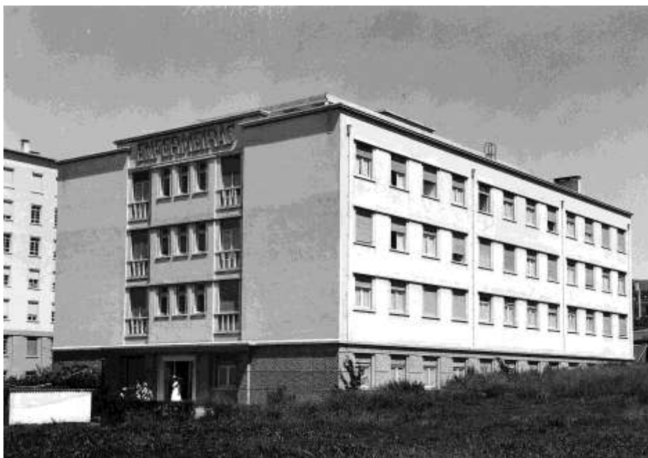
Figura 16. Escola de Enfermagem