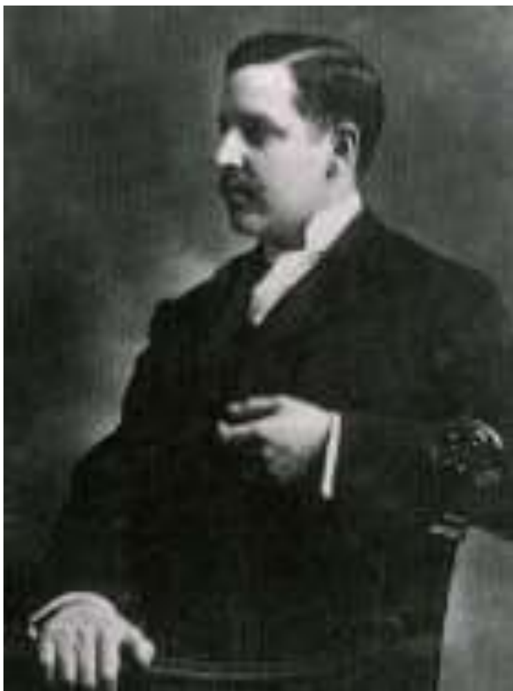
Figura 9. Francisco Gentil

tomar todas as iniciativas referentes ao estudo dos tumores e da luta anti-cancerosa.