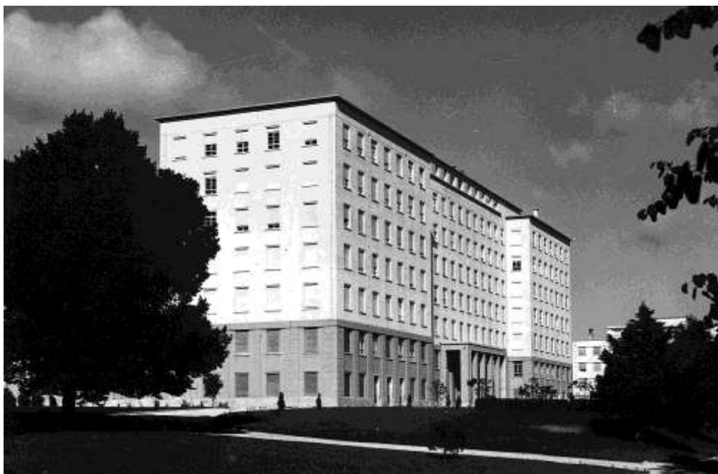
Figura 17. Pavilhão Hospitalar

Tinha uma capacidade para internar cerca de 350 doentes, nas melhores condições e tendo, como era comum na época, um andar dedicado a "Doentes privados". Tinha condições assistenciais e de trabalho excepcionais, atendendo-se aos mais pequenos pormenores.