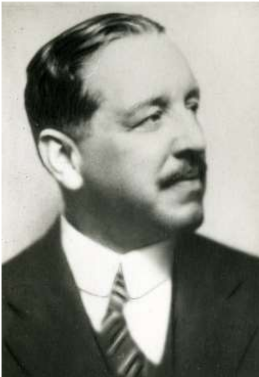
Figura 4. Francisco Gentil