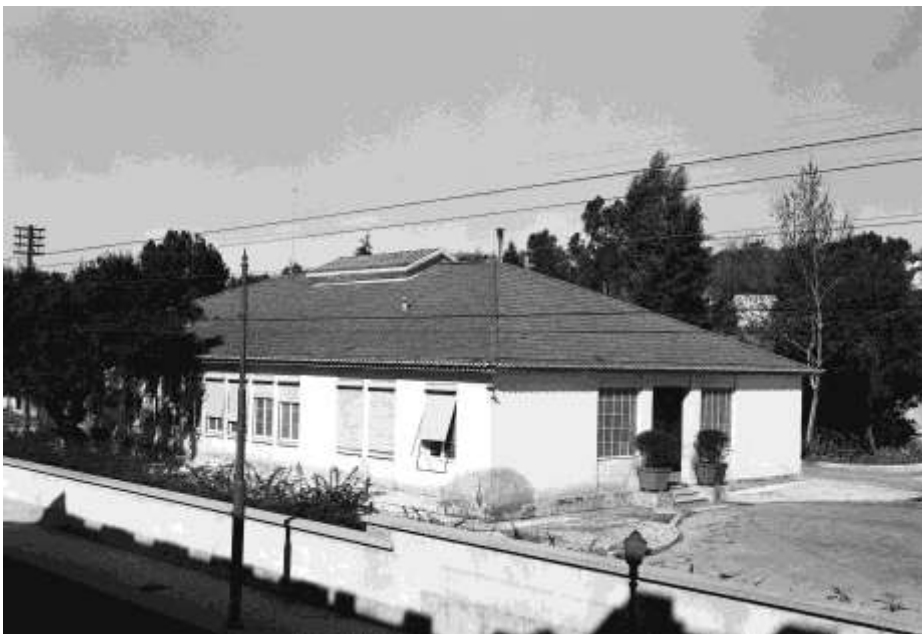
Figura 14. Pavilhão A

Em 1937 na III Reunião semanal do IPO dizia Francisco Gentil: