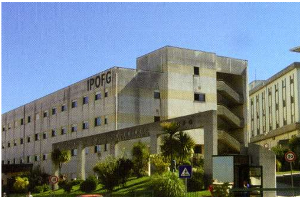
Figura 29. Centro de Coimbra

Em 2003 passou a organizar Centros de responsabilidade integrados e foi o primeiro Centro Regional de Oncologia a adoptar o sistema de classificação de Doentes pelos DGH's. Como é evidente desenvolveu também outros serviços Rastreio, Estomoterapia, Radioterapia, Rádio-cirurgia, Serviço Social, etc.