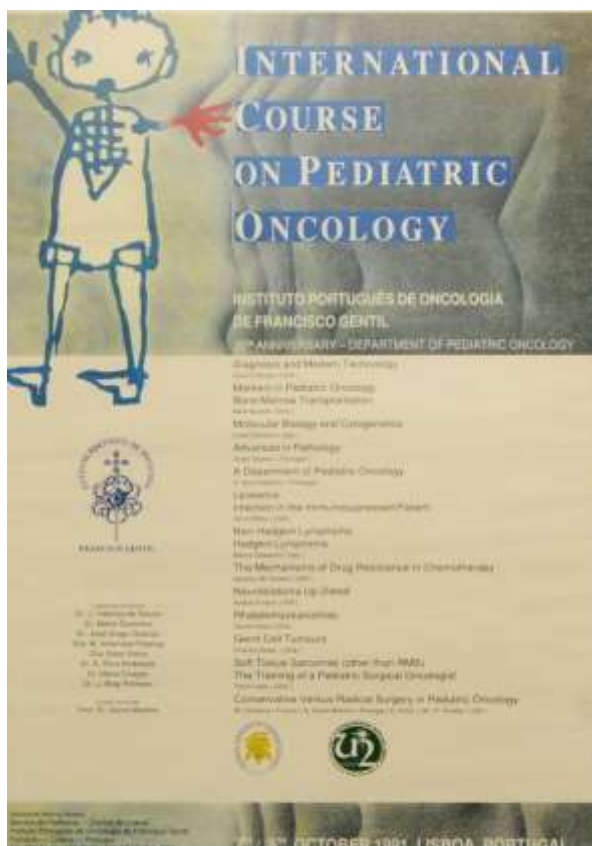
Figura 26. Cartaz do International Course on Pediatric Oncology