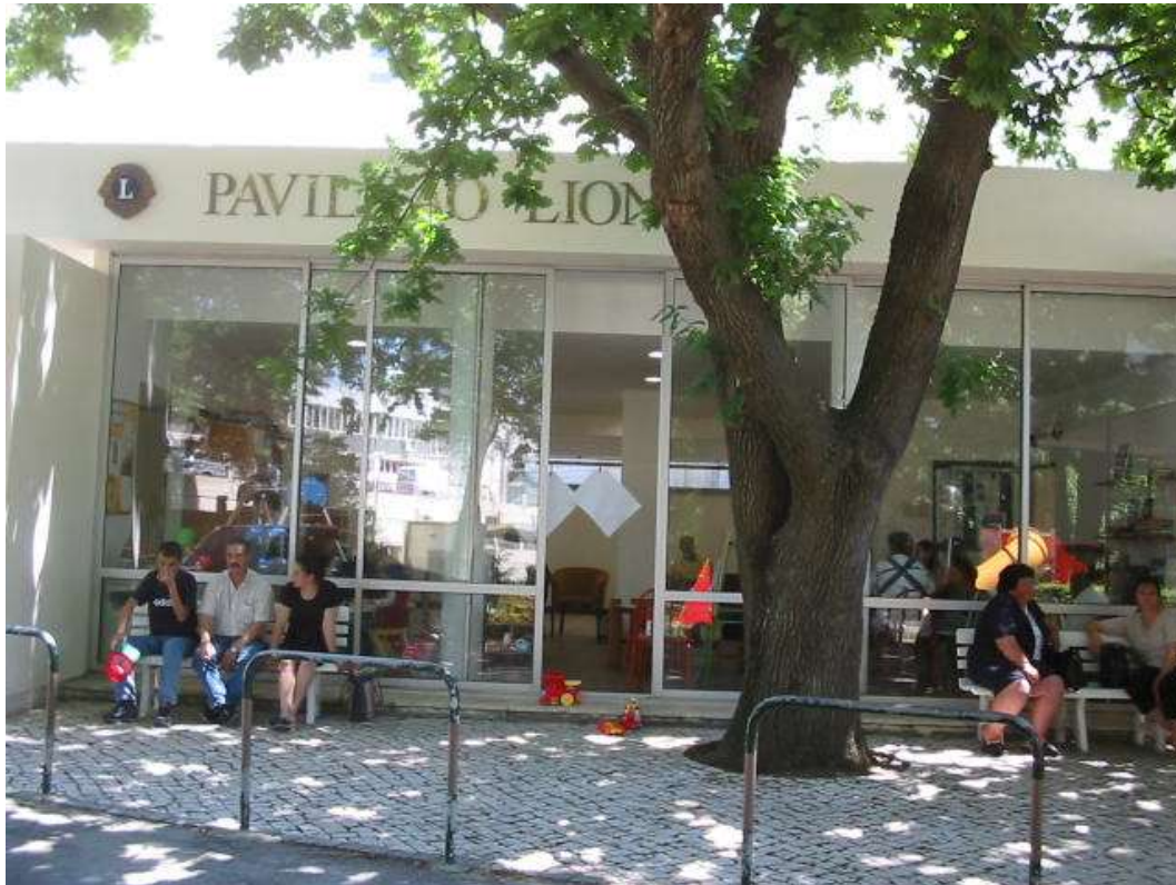
Figura 27. Pavilhão Lyons

Em 1999 foi inaugurado um confortável e eficiente Hospital de Dia, no denominado "Pavilhão do Rádio", junto ao qual funciona actualmente a Consulta Externa. No mesmo ano foi implementada a Telescola, permitindo conservar o contacto com os Colegas de Escola e manter o acesso às aulas durante os internamentos.