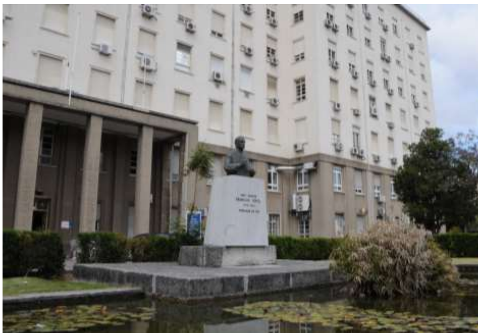
Figura 38. Estátua de Francisco Gentil no jardim do Centro do IPOFG, em Lisboa

Aqui, mais uma vez, é de salientar a acção e apoio constante da Liga Portuguesa Contra o Cancro, nomeadamente com a criação da modelar Unidade de Cuidados Continuados, importante até para o ensino.