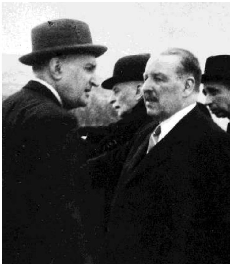
Figura 8. Oliveira Salazar e Francisco Gentil

Era rigoroso e exigente e até mesmo severo, ainda que habitualmente justo e amigo. Mas se o interesse dos Doentes estivesse em causa ninguém nem nenhuma burocracia o fazia parar. Independentemente de ser um óptimo cirurgião, professor e organizador, era, acima de tudo um médico cuidadoso e solícito.