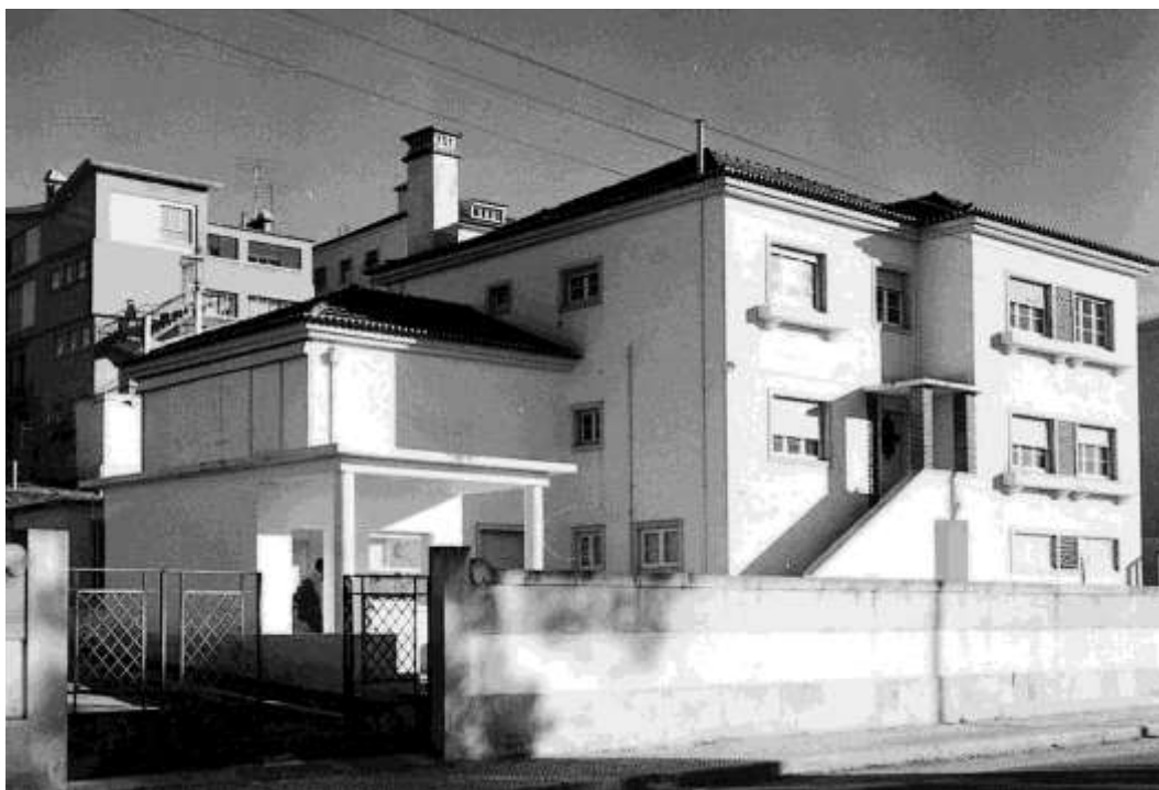
Figura 28. Foto do Centro inicial, em Coimbra

Fiel ao seu mais nobre compromisso, “a excelência de bem cuidar o Doente Oncológico”, tem múltiplos projectos para o futuro, entre os quais se destacam a criação de uma Unidade de Cuidados Continuados e de um lar para doentes, uma nova Unidade de internamento, a criação de um Serviço de Medicina Nuclear e melhorias na Radioterapia e Ultrassonografia endoscópica.